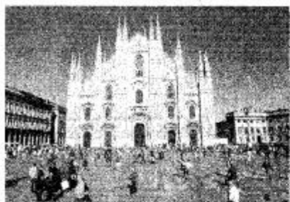
P.zza Duomo (Marka)