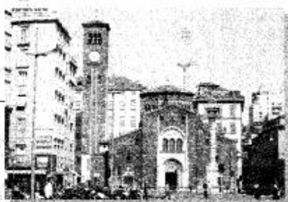
P.zza S. Babila