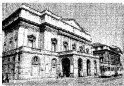
P.zza Della Scala (Marka)

■ Microzona 1: È la zona Scala, Manzoni, Vittorio Emanuele, San Babila. Delimitazione perimetrale: Piazza Scala parte, via Mattioli parte, Piazza Meda, Corso Matteotti parte, via San Pietro all'Orto parte, via Verri, via Sant'Andrea, via della Spiga, Corso Venezia, via Palestro, Piazza Cavour parte, via dei Giardini, via Monte di Pietà, via dell'Orso parte, via Broletto, via Bassano Porrone, via San Dalmazio, Piazzetta Ferrari, via Filodrammatici, Piazza della Scala