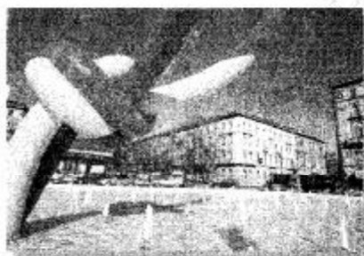
P.zza Cadorna (Marka)